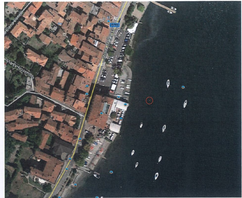
Estratto Satellitare - scala 1:2000

GEOM. FABRIZIO BALLOTTA P.ZZA CARABELLI N. 1 - 28046 MEINA (NO) P.IVA 01851470037 - C.F. BLL FRZ 77T22 A429A TEL/FAX 0322.66.96.12 CELL. 333.30.31.898 E.MAIL FABRIZIOBALLOTTA@TISCALI.IT