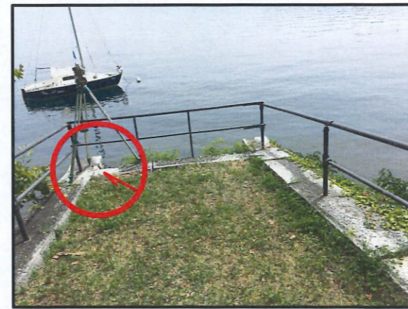
STAZIONE DI BATTUTA