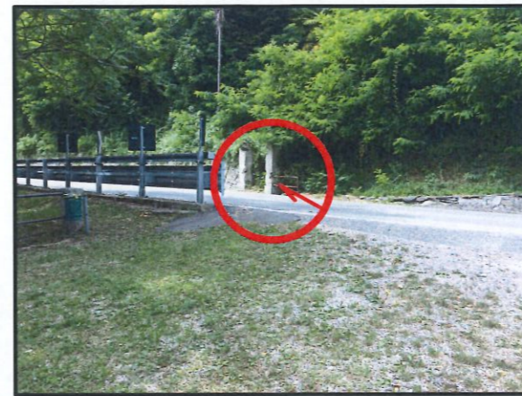
PILASTRO CANCELLO DX