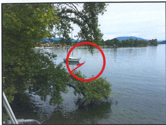
UBICAZIONE BOA 1