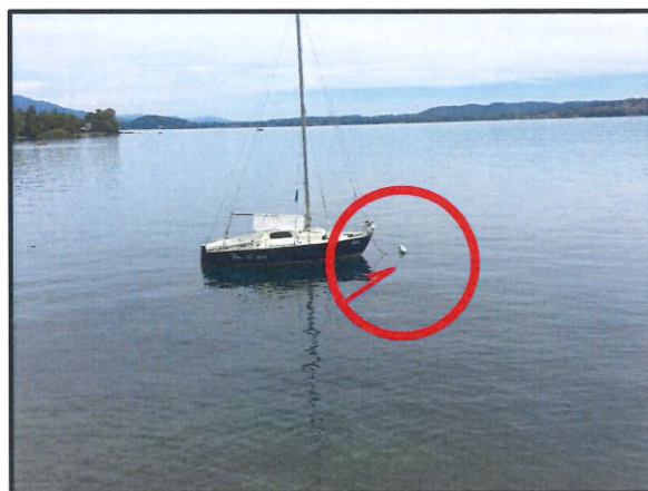
UBICAZIONE BOA 2