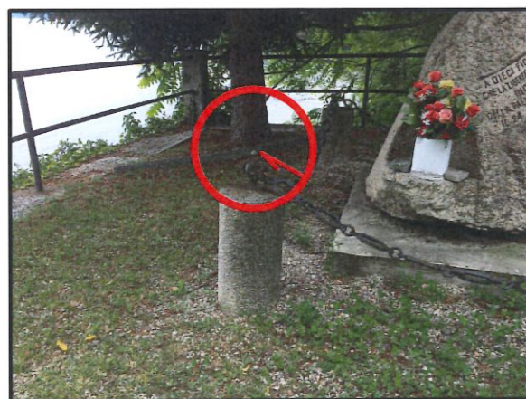
CIPPO LAPIDEO MONUMENTO